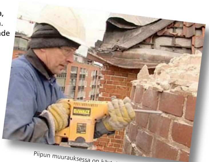
Piipun muurauksessa on käytetty vahvaa laastia

kaupunkimaisemasta ja myös itse piipusta. Yhdessä työmiesten kanssa ihmettelimme, että piippu oli sisältäpäin aivan puhdas, ikään kuin siinä olisi poltettu kaasua, eikä puupöllejä. Oletettavasti sade oli huuhtonut vuosien saatossa piipun putipuhtaaksi. Ylimpiä kerroksia lukuun ottamatta, piippu oli yllättävän hyvässä kunnossa ja työmiehillä oli täysi työ saada tiilikerrokset irtoamaan poravasaran avullakin. Kun piippu oli purettu viikon päästä,