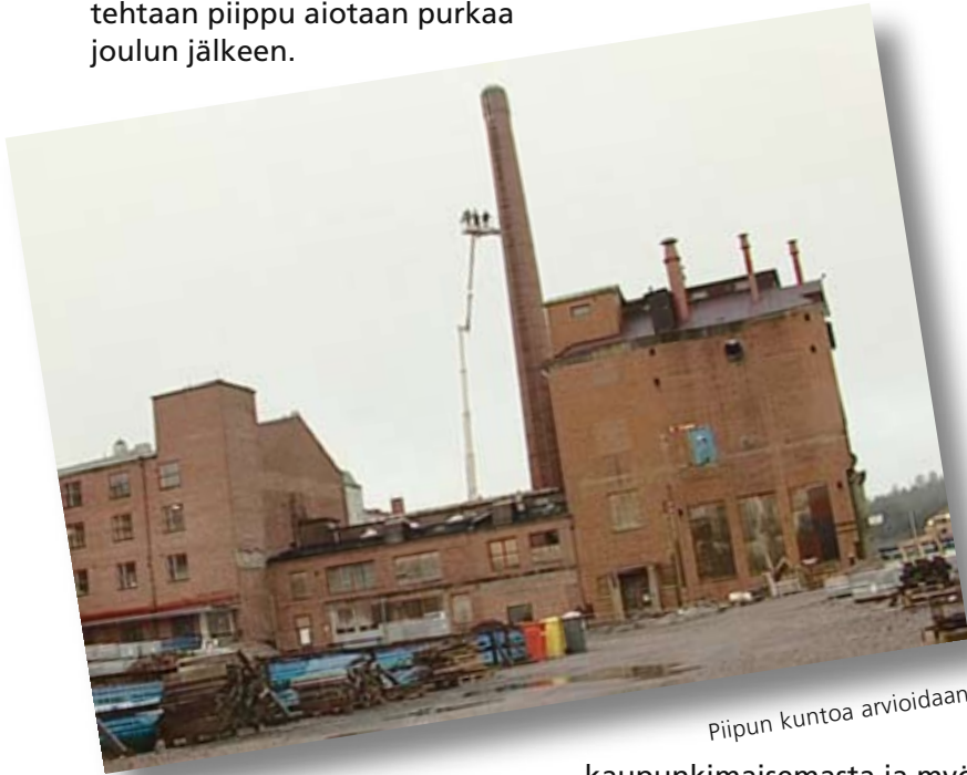
Piipun kuntoa arvioidaan